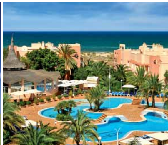
Direkt am Meer in Oliva abschlagen.